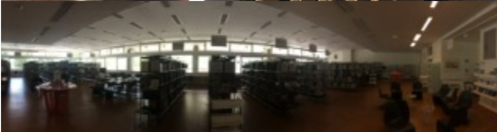
LYON- FRANKFURT 2017 Chiara Klapez Stagiaire allemande