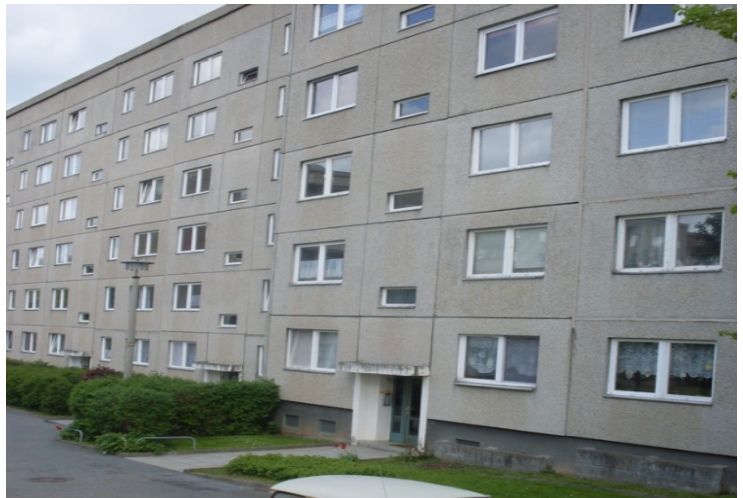
Plattenbauten: Mit Asbest verseucht?

Und zudem muss man sagen, dass ja auch im Westen jede Menge Asbest verbaut wird. Und wer fragt eigentlich hier nach den Gründen, wenn Menschen an Lungenkrebs sterben.